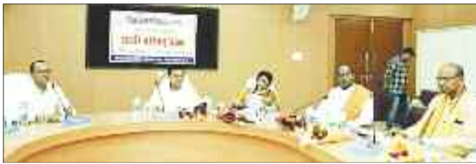
डीएमएफ की बैठक में उद्योग मंत्री, सांसद व विधायक।