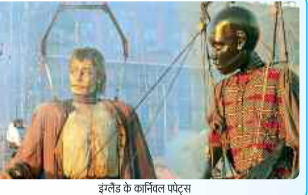
इंग्लैंड के कार्निवल पपेट्स

शैडो-पपेट्स का तमाशा भी काफी पसंद किया जाता है। वास्तव में शैडो-पपेट्स ऐसी आकृतियां होती हैं, जिन पर खास एंगल से रोशनी डालने पर पीछे लगे पर्दे पर उनकी तस्वीर उभर आती है। ये पपेट्स काफी रंग-बिरंगे होते हैं। शो के दौरान इन्हें हंडल करने वाले कलाकार, डायलॉग्स के बीच-बीच में बॉस से बनी सीटी भी बजाते रहते हैं, जिससे दर्शकों में उत्साह और बढ़ जाता है।