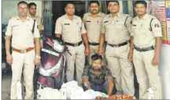
पुलिस गिरफ्त में आरोपी व जप्त शराब की खेप।