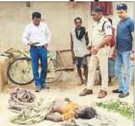
घटना स्थल पर जांच करती पुलिस की टीम