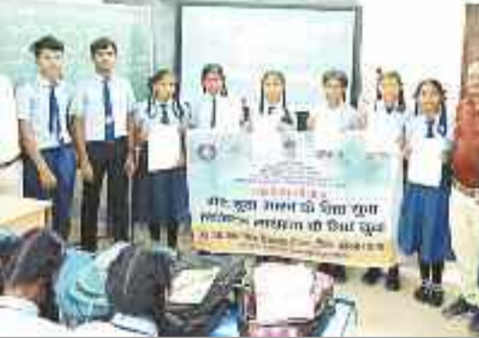
प्रतियोगिता में शामिल छात्र-छात्राएं।