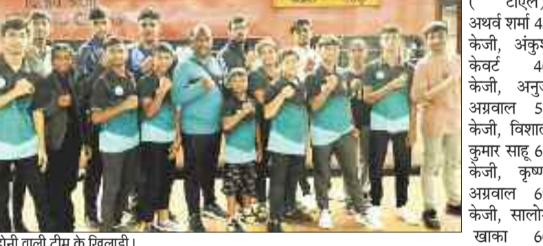
रवाना होनी वाली टीम के खिलाड़ी।

हरिभूमि न्यूज ►► कोरबा रायपुर थाई बॉक्सिंग एसोसिएशन ऑफ छत्तीसगढ़ के द्वारा राज्य स्तरीय थाई बॉक्सिंग चैंपियनशिप का आयोजन अंजना यूनिवर्सिटी नर्धा रायपुर में 18 से 20 जुलाई तक किया गया है। जिसमें सभी जिलों के थाई बॉक्सर्स में भाग ले