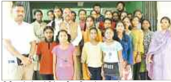
निरीक्षण के दौरान कैबिनेट मंत्री रामविचार नेताम व बच्चे।