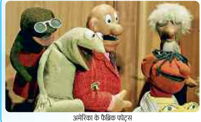
अमेरिका के फ़ैब्रिक पपेट्स