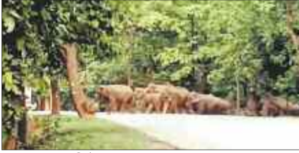
सड़क पार करता हाथियों का झुण्ड।

झुंड से अलग हुआ लोनर हाथी बुधवार की रात शहरी सीमा पर पहुंच गया था। खबर मिलते ही वन विभाग की टीम अलर्ट हुई और हाथी को जंगल में खदेड़ा। इधर 32