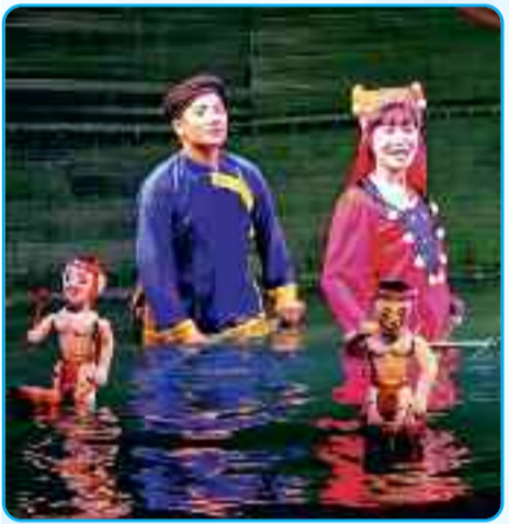
वियतनाम में खूब पॉपुलर हैं वाटर-पपेट्स

वियतनाम में पपेट्स का खेल एक हजार साल से भी अधिक पुराना माना जाता है। यहां पपेट्स आर्ट को 'मुआ रोई नॉक' कहते हैं, जिसका मतलब है-पानी पर डांस करने वाली पपेट्स। इन पपेट्स को नचाने वाले आर्टिस्ट्स कमर तक पानी में खड़े होकर इनका तमाशा दिखाते हैं। यहां