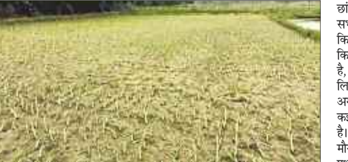
इस तरह खेत में सूख रहे धान की फसल।

खंड वर्षा को लेकर किसानों की चिंता बढ़ गई है। ग्रामीण क्षेत्रों की अपेक्षा शहरी क्षेत्रों में अधिक वर्षा देखने को मिल रही है। जिले में अब तक 4733.2 मिलीमीटर वर्षा खेती के लिए पर्याप्त नहीं है। फसल के अनुकूल वर्षा के अभाव में खेती में प्रगति नजर नहीं आ रही है। धूप व उमस हावी होने के कारण थरहा खेतों में पानी की कमी होने लगी है। अच्छी वर्षा की आस में आसमान निहारते किसानों को यहां वहां उड़ते बादल निराश कर रहे हैं। पर्याप्त सिंचाई सुविधा नहीं होने से जिले के किसान अब भी मानसून आश्रित खेती पर निर्भर हैं। समय पर वर्षा नहीं होने से पिछड़ती