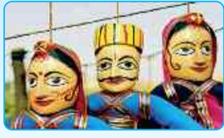
प्रचलन है। छड़ पुतलियों के खेल बंगाल में पुतुलनाच और बिहार में यमपुरी के नाम से जाना जाता है। कुछ स्थानों पर दस्ताणा पुतली भी खूब मनोरंजन करती है, इन्हें हथेली में दस्ताणा की तरह पहनकर नचाया जाता है।

रामायण और रामकथा हमारे देश के साथ-साथ दुनिया के कई देशों में प्रचलित है। इंडोनेशिया में अलग-अलग स्थानों पर रामकथा का प्रदर्शन पपेट्स के माध्यम से किया जाता है। यहां भी चीन की तरह शैडो पपेट्स अधिक प्रचलित हैं।