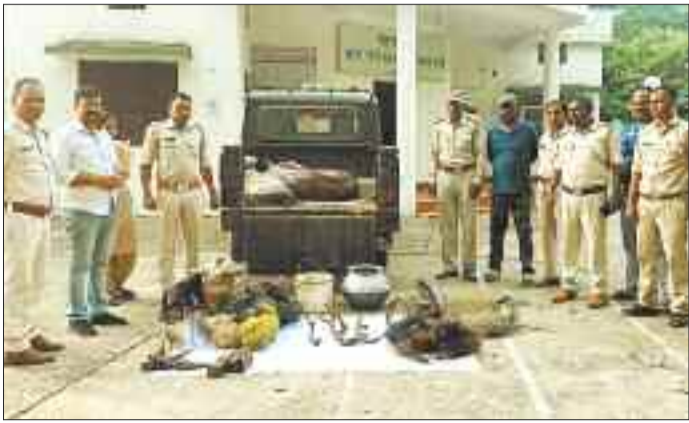
वन विभाग द्वारा जप्त किए गए चीतल के सिंग व शिकार में इस्तेमाल किए जाने वाले सामान।

दमिया के जंगल में बड़ी मात्रा में चीतल व जंगली सुअर जैसे वन्य प्राणियों का बसेरा है लेकिन इन वन्य प्राणियों की सुरक्षा के नाम पर महज खानापूर्ति की जा रही है। जिसके चलते इन वन्य प्राणियों की जान लगातार सांसत में है। हर साल गर्मी के सीजन में इन वन्य प्राणियों की कुत्तों के हमले से या फिर सड़क हादसे में मौत होती है तो वहीं दूसरी ओर इन वन्य प्राणियों का शिकार करने वालों को तादाद भी बढ़ती जा रही है। ऐसा ही एक मामला सामने आया है। मुखबीर से मिली सूचना पर वन विभाग के अधिकारियों ने एक ग्रामीण के घर दबिश देकर जंगली सुअर व चीतल का मांस, शिकार में इस्तेमाल किए जाने वाले सामान जप्त किया है।